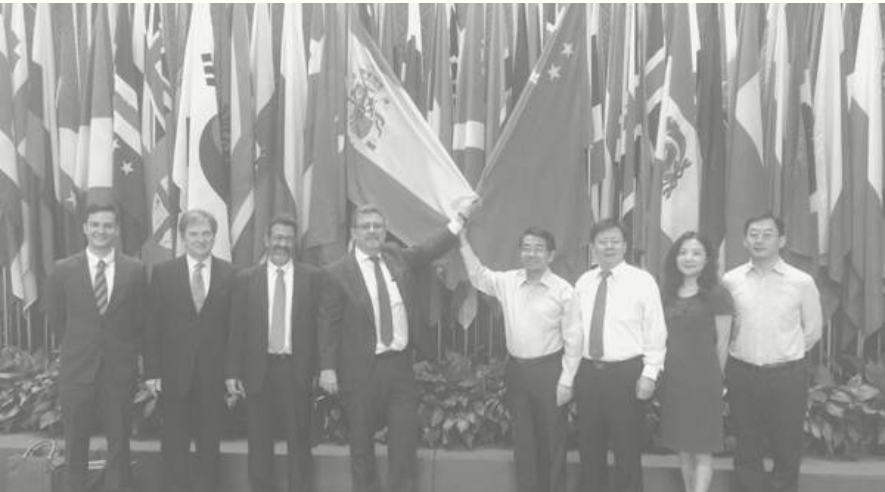
PRESENCIA DE ZEUMAT DURANTE LA FIRMA DE CREACIÓN DE INSTITUTO EN HANBAN (JULIO 2016 EN BEIJING, CHINA)

Hemos sido promotores de la creación del Instituto Confucio de la Universidad de Zaragoza y participamos en las tareas de difusión del Instituto y de sus actividades culturales