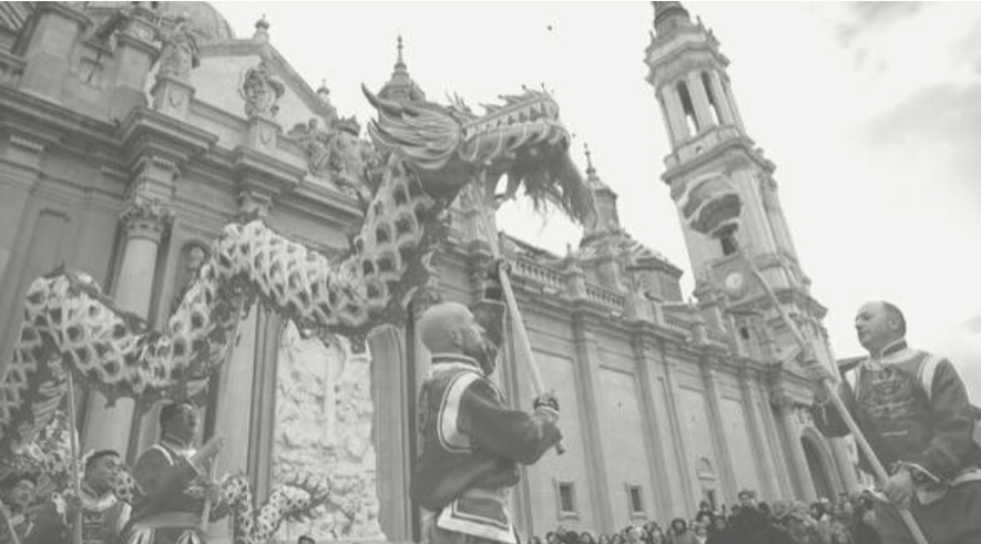
ACTIVIDAD DE AÑO NUEVO CHINO ORGANIZADA POR ZEUMAT E INSTITUTO CONFUCIO DE ZARAGOZA