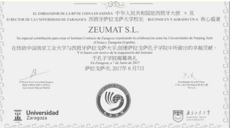
RECONOCIMIENTO DE EMBAJADOR CHINO POR LA CONTRIBUCIÓN DE ZEUMAT A INSTITUTO CONFUCIO DE ZARAGOZA